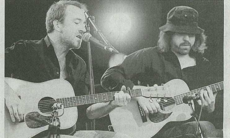
«Sf and the ladyboys» a eu le plaisir d'ouvrir le festival.