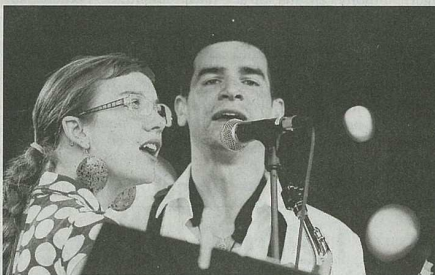
«Mura Peringa» a fait résonner des airs latinos et de salsa.

La programmation non-stop était assurée grâce à deux ensembles de percussions. Les «mille et une battes», une batucada de Geispolsheim, et les «Nez rouges», des percussions africaines, ont divertis le public entre les prestations des cinq groupes de la soirée.