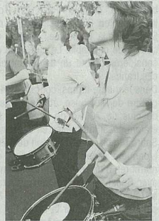
Les «Mille et une battes» de Geispolsheim ont imposé leur batucada tout au long de la soirée.

De lourdes responsabilités, qui ont cependant permis aux jeunes bénévoles de contribuer largement au succès du Feg'stival 2010. Leur expérience acquise lors de