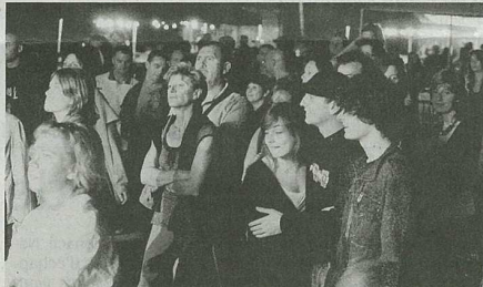
Le public est venu en nombre.

sont ensuite invités, avec «Mura Peringa». Une poignée de danseurs a même investi le parterre devant la scène. Le trio «Jesers» a poursuivi la soirée, avec une sorte de slam qui racontait un voyage du Cap Vert au Sénégal, avec un détour par Mulhouse. «Hakiliiman Si» et sa tonalité reggae ont ensuite investi la scène, avant de laisser la pla-