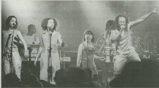
Le Feg'stival 2010 – ici «Hakiliiman Si» – a connu un succès considérable.

«Le programme a été pensé pour aller crescendo», a raconté Hervé, tout en préservant des répertoires éclectiques et accessibles. «Sf and the ladyboys» a ouvert le bal avec un mélange de pop et de folk. Le latino et la salsa se